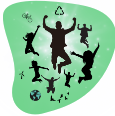
TABLE-RONDE : Investir pour transformer la société

Au programme : quiz et forum avec des structures engagées du territoire (mobilité douce, énergie, alimentation durable...)